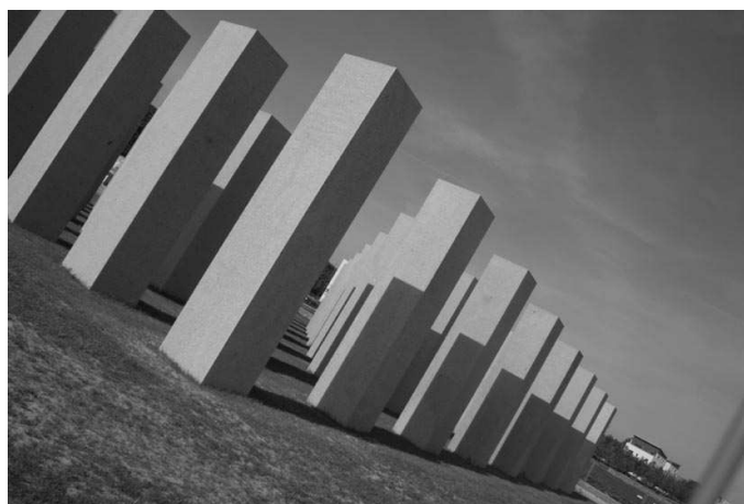
"Un alignement pour l'éternité"

Avec l'"alignement pour l'éternité" ( Le Rennais N° 374 - 15 mai 2006) ou l'"Alignement du XXI e siècle", selon le nom rapporté par Ouest-France (17 - 18 juin 2006), les goûts artistiques de la municipalité rennaise ont pris une autre dimension, en surface, en hauteur, en poids et en coût.