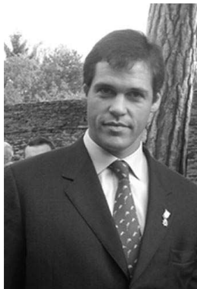
Au Champ des Martyrs d'Avrillé

* SAMEDI 25 NOVEMBRE: Sortie du Cercle Jean de Beaumanoir A la découverte du pays de Dol