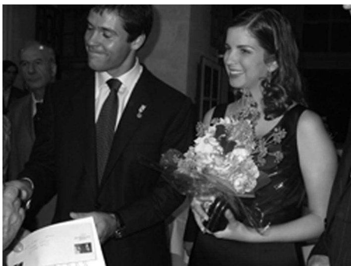
Le prince et la princesse remercient la président du cercle Henri IV (Béarn)

* LES 24 ET 25 SEPTEMBRE EN ANJOU: Mgr le prince Louis de Bourbon et Madame la princesse Marie-Marguerite de Bourbon