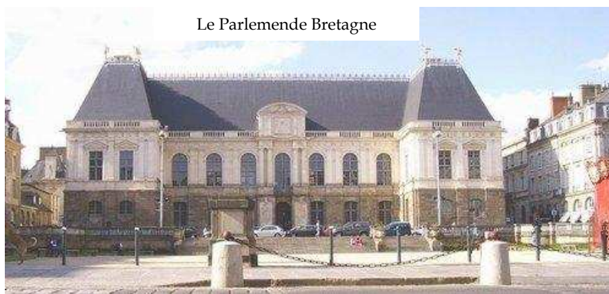
Le Parlement de Bretagne

Au Grand Baillage de Rennes était attribué pour ressort celui, immense, de l'ancien présidial. Les deux autres recouvraient respectivement ceux de Nantes et de Quimper. Ce dernier se voyait augmenter d'une partie de l'ancien ressort du présidial de Vannes, lequel était partagé en deux : Quimperlé, Hennebont et Auray étaient attribués au Grand Baillage de Quimper, tandis que Vannes, Sarzeau et Ploërmel étaient placés sous la dépendance du Grand Baillage de Nantes. Des pouvoirs en blanc étaient expédiés pour la nomination des nouveaux magistrats, rémunérés directement par le Roi (tandis qu'il était sursis au remboursement des anciennes charges). Une initiative aussi brutale ne pouvait que soulever une réprobation la plus vive tant de la part des défenseurs des libertés bretonnes inscrites dans l'édit d'Union (1532) que de l'opinion publique accoutumée à voir dans les Parlements, les défenseurs du peuple auprès du Roi dont ils n'étaient cependant que les premiers juges et représentants. Dès les premiers jours de Mai, la Cour de Rennes, à laquelle s'étaient joints les personnels de toutes les juridictions (ordinaires et extraordinaires) de la province, était venue rappeler que de pareils changements portant atteinte à la Constitution de la province ne pouvaient être mis en œuvre sans qu'ils aient été consentis par les Etats. Le procureur syndic des Etats, Mr de Botharel, faisait entendre à ce sujet sa protestation 3