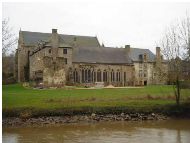
Abbaye de Léhon